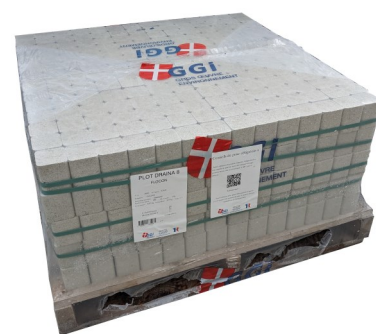
Palette modules Draina® 8

** Découper la housse de façon à pouvoir la refermer par le dessus, si besoin.